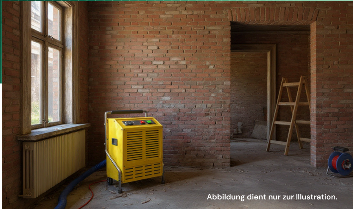
Abbildung dient nur zur Illustration.

Bautrocknung mit jahrzehntelanger Erfahrung und treuer Stammkundschaft im Odenwald