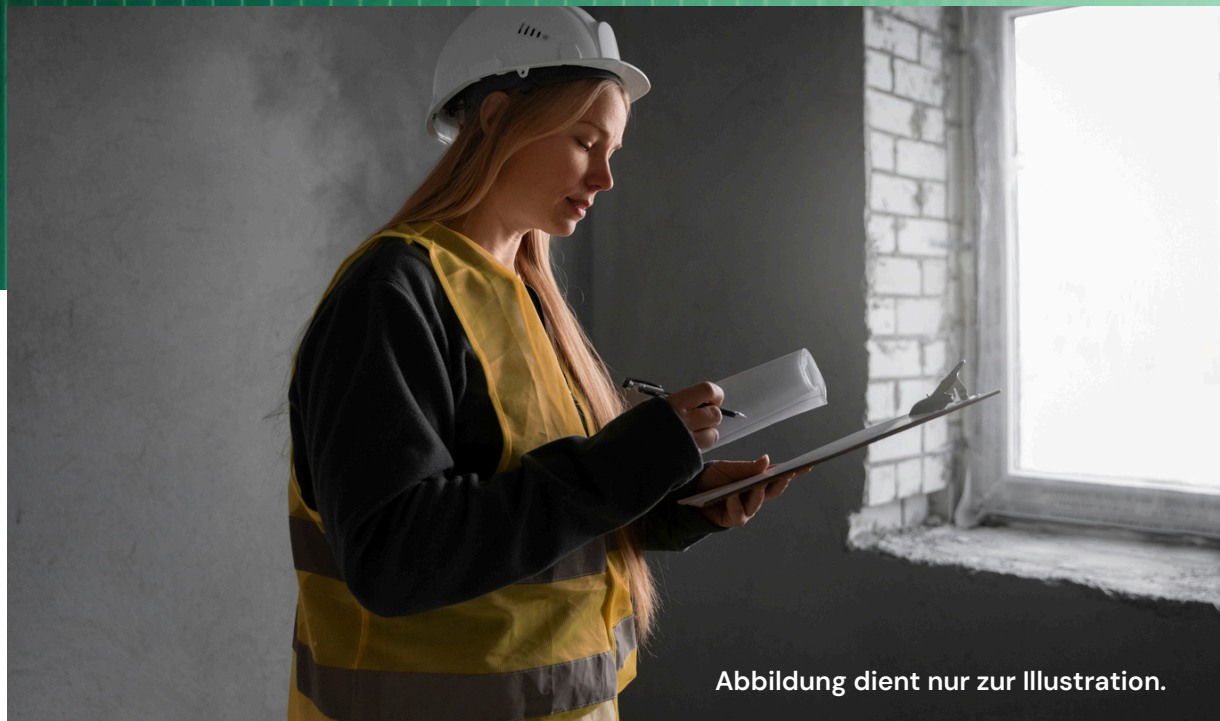
Abbildung dient nur zur Illustration.

Traditionelles Bauhandwerk mit fast 30 Jahren Erfahrung und regionaler Bekanntheit im Raum Mannheim