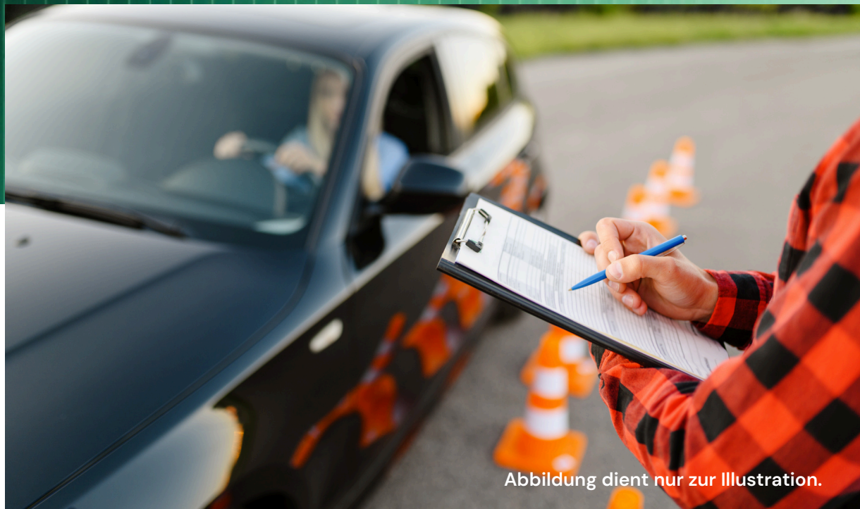
Abbildung dient nur zur Illustration.

Fahrschule mit enormer Nachfrage, langen Wartelisten und großem Wachstumspotenzial in Region Frankfurt (Oder)