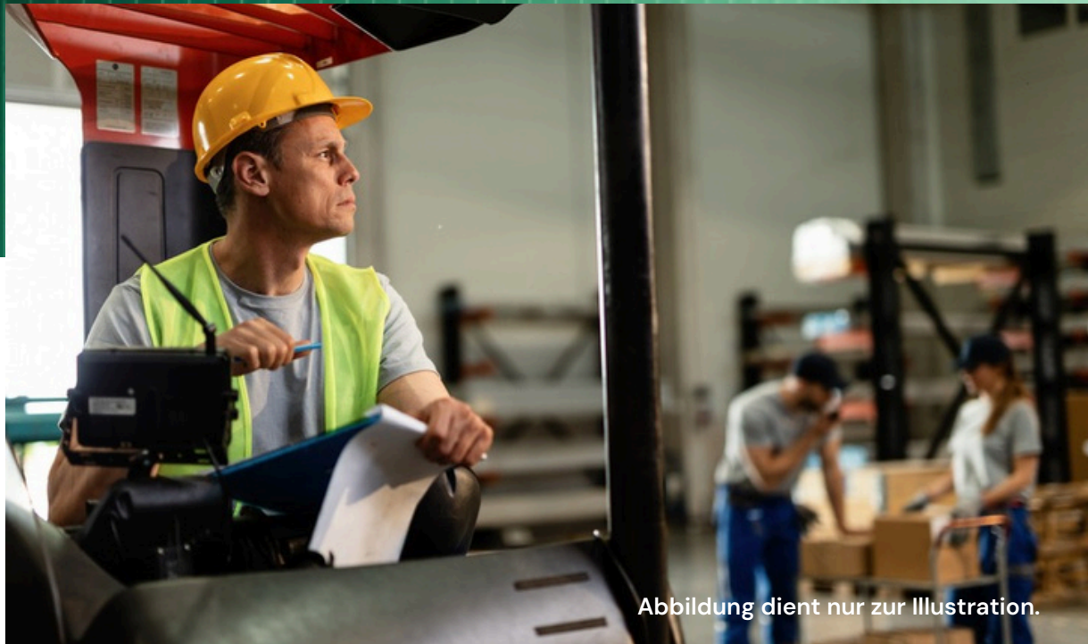
Abbildung dient nur zur Illustration.

Etabliertes Schulungsunternehmen für Kran-, Bagger- und Staplerfahrer bei Hannover