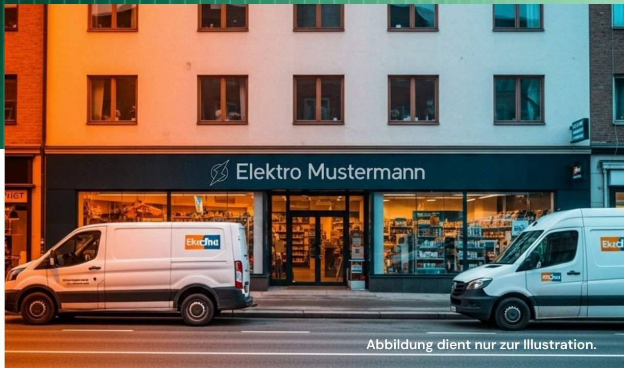
Abbildung dient nur zur Illustration.

Bekannter Elektro-Handel & Installateur mit langer Tradition im Rhein-Main-Gebiet